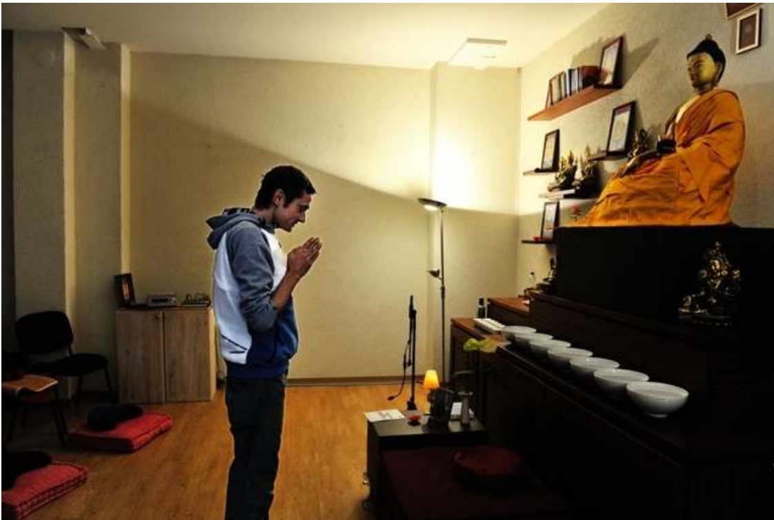
Le centre bouddhiste Atisha à Genève.

Le Centre intercantonal d'information sur les croyances a recensé et cartographié la diversité religieuse du canton. Elle a présenté ses résultats mercredi.