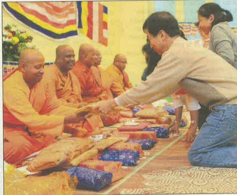
► Vue de Genève insolite.

Aujourd'hui, ce sont plus de 407 communautés religieuses et 272 lieux de culte qui ont été